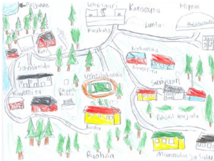
Kotiseutuni on kiva, viihtyisä, koska on hyvät mahdollisuudet harrastaa kaikkea, kavereita Säykissä, Sarvivuoressa, Kinkkomaalla, kaupungissa... (Poika, 5. luokka.)