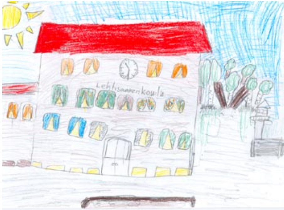
Minun kotiseutuni on Lehtisaari. Asuin ennen Helsingissä, joten minulla on vähän niin kuin kaksi kotiseutua. Kotiseudullani on ala- ja yläaste. (Tyttö, 4. luokka.)